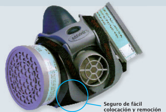
Seguro de fácil colocación y remoción